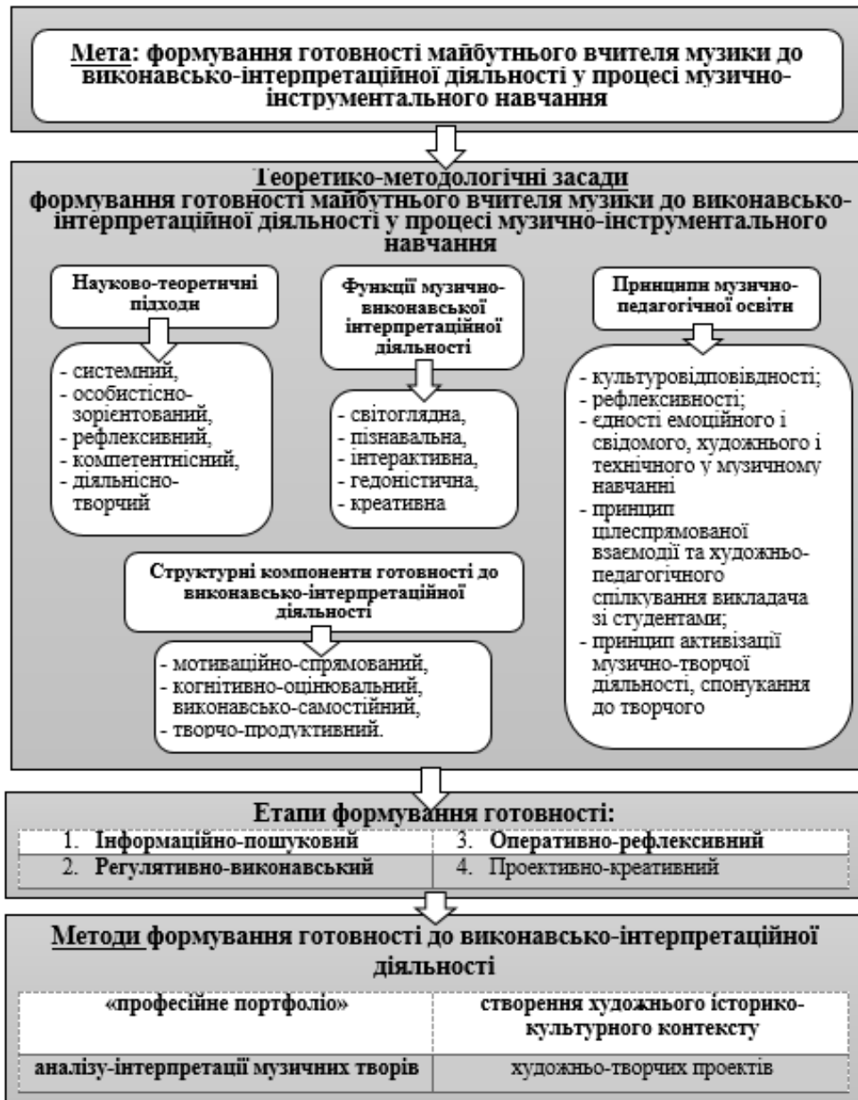
Рис. 2. Модель формування готовності майбутнього вчителя музики до виконавсько-інтерпретаційної діяльності в процесі музично-інструментального навчання

Визначені методи позитивно впливають на формування готовності майбутнього вчителя музики до виконавсько-інтерпретаційної діяльності, сприяють удосконаленню особистісно-духовної сфери майбутніх фахівців, їхньої здатності до сценічного перевтілення, рефлексії тощо. Модель формування готовності майбутнього вчителя музики до виконавсько-інтерпретаційної діяльності в процесі музично-інструментального навчання унаочнена на рисунку (Рис. 2).